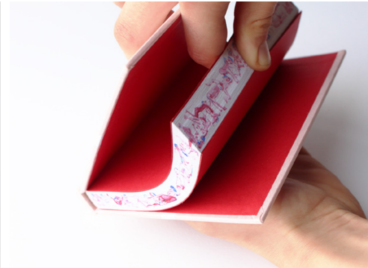
Liber amicorum , сотрудничество с Anastasia Gaspard