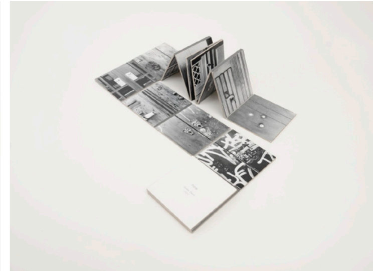
Porte , сотрудничество с Aurélia Deniot